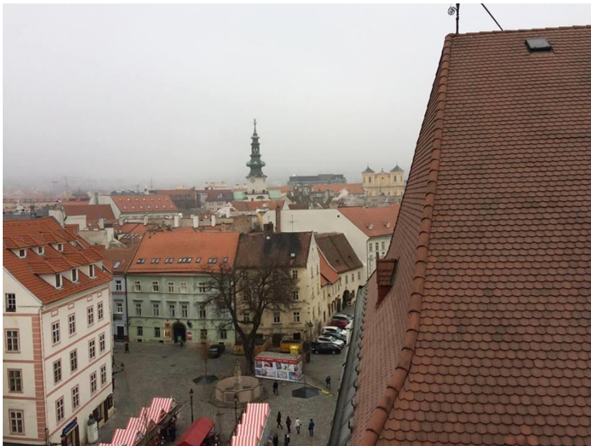
Pripravila : Natálka , 6.A