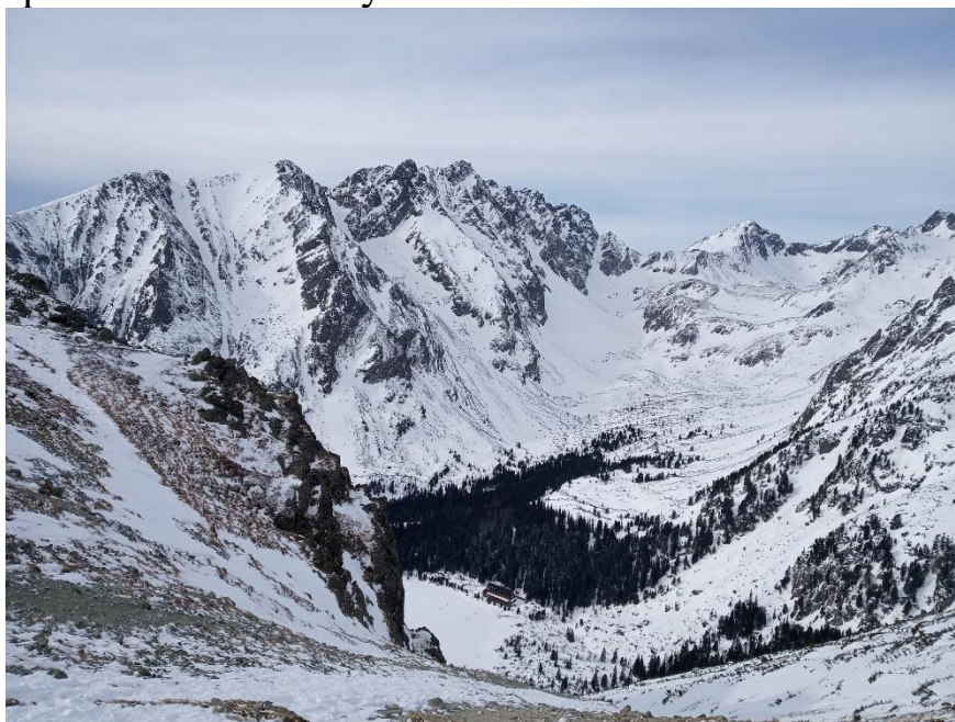
Pohľad z Ostrvy na Popradské pleso

„žbrndou“ (multivitamínový „energeták“). Keď sa konečne dostávame na vrchol prichádza ďalšia výzva – chodenie v mačkách po kameňoch. Počas oddychu si všímame asi päťčlenné stádo kamzíkov, ktoré sa pasie na úpätí Tupej. Oddýchame si, najeme sa, pofotíme kamzíky a prichádza čas rozhodnúť sa, čo ďalej. Po zhodnotení podmienok smerom na Batizovské pleso sa rozhodujeme pre zostup späť na Popradské pleso. Deň nato sa na Facebooku dočítame, že jednému turistovi trasa na Batizovské pleso trvala 3 hodiny s prekonávaním nafúkaného snehu v žľabe. Cestou dole uvoľňujeme tabule snehu o veľkosti 50x50cm. Neskôr mi tato ukazuje ako sa dá spúšťať na cepíne a aj ja to len tak zo srandy skúšam. Bohužiaľ tým, že sneh je veľmi tvrdý to moc nefunguje. Potom ako prídeme na chatu sa naobedujeme, oslávime dokončenie „zimnej magistrály“ a odprevadíme nášho kamaráta na vlak. On nastupuje do zubačky a my si v TEŽ-ke užívame západ slnka nad Nízkymi Tatrami.